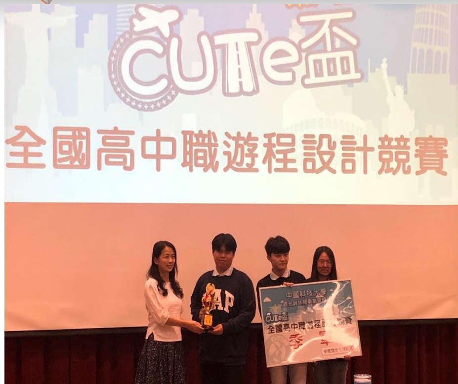
全國高中職遊程設計競賽 第三名