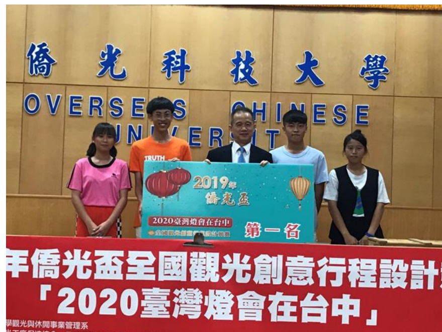
全國高中職創意行程競賽 第一名